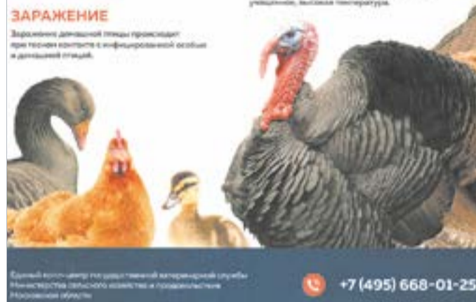
Справочный центр по вопросам ветеринарной службы Московской области, ветеринария и государственная ветеринария +7 (495) 668-01-25

Заражение домашней птицы происходит при тесном контакте с инфицированной особью и дикими птицами.