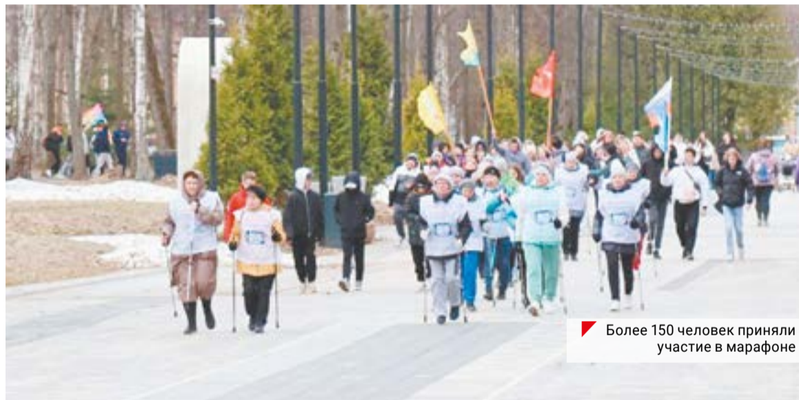
Более 150 человек приняли участие в марафоне