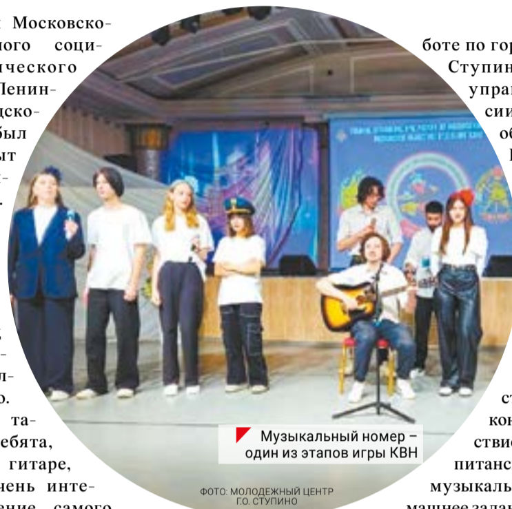
Музыкальный номер – один из этапов игры КВН

Студенты Подмосковья сыграли в «безопасный» КВН в Ступине