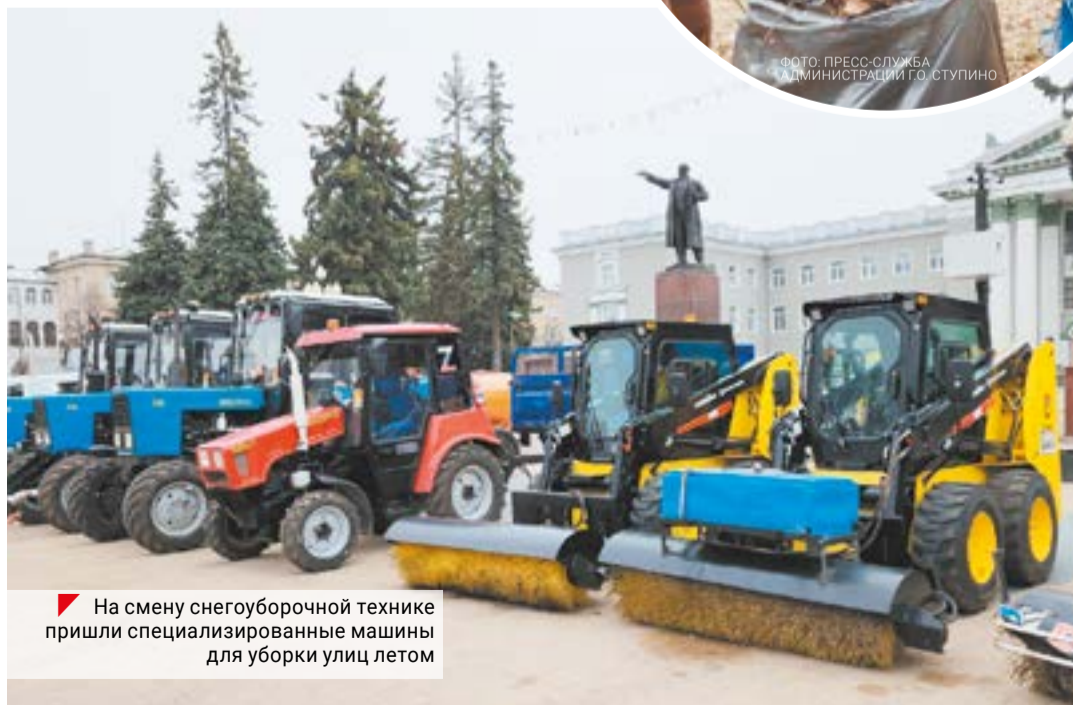
▶ На смену снегоуборочной технике пришли специализированные машины для уборки улиц летом

Парад коммунальной техники открыл первый субботник в муниципалитете