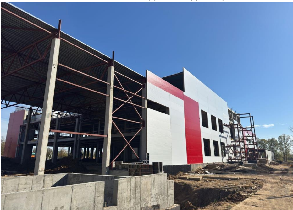
Строительство завода ООО «ПК Печагин» в п.Михнево

Строительство завода по производству майонеза и соусов п.Михнево Срок реализации проекта: 2022-2025. Инвестиционная стоимость – 921 млн.руб, планируемые рабочие места – 100.