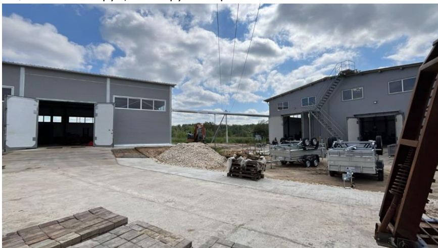
Новые производственные корпуса завода «Трейлер»

Расширение производства автоприцепов в г.Ступино. В рамках программы «Земля за 1 руб» предоставлен муниципальный земельный участок площадью 3,8 га. Срок реализации проекта: 2022-2025. Инвестиции – 92 млн. руб, планируемые рабочие места – 15.