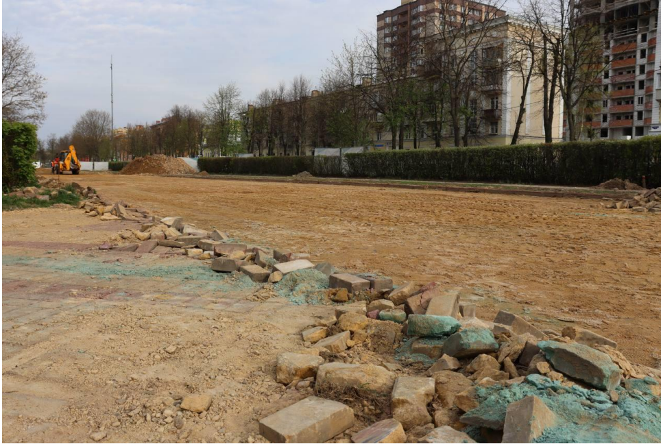
Работы по благоустройству проспекта Победы г.Ступино

В центре города ведется реновация территории Ступинского хлебозавода, построенного в 50-ые годы прошлого века. Это еще одна будущая точка притяжения, так как во внутреннем дворе завода планируется создание арт-зоны и креативного кластера. В настоящее время в одном из отреставрированных корпусов хлебозавода уже работают предприятия торговли и общественного питания. Проектом предусмотрена пекарня, поэтому горожане не останутся без свежей выпечки. Планируемый объем коммерческой недвижимости – 5000 кв.м. В результате реализации проекта будет создано 300 рабочих мест в сфере малого бизнеса.