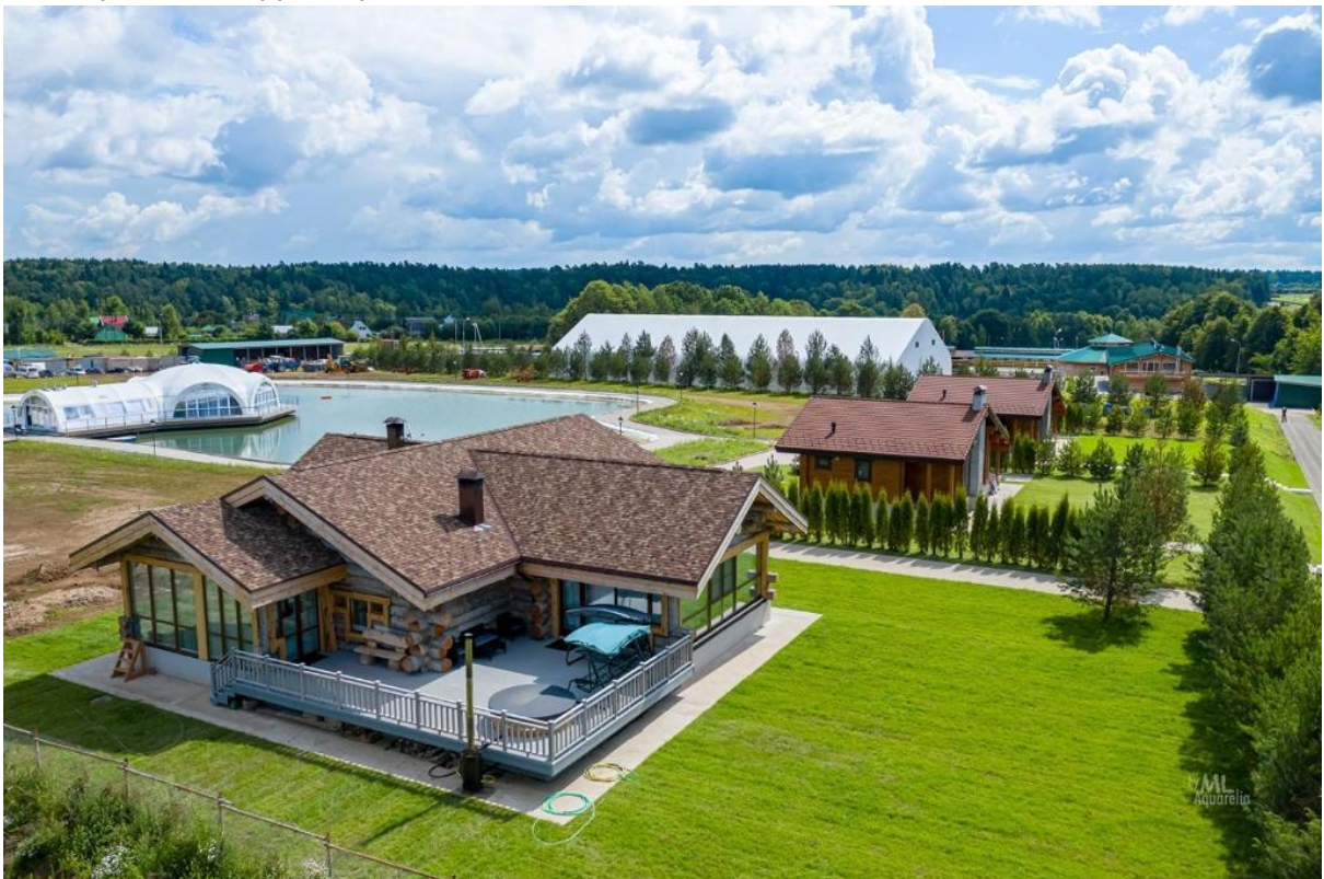
Фото: конноспортивный загородный клуб «GreenHorse» в д.Дубечино

Рынок услуг туризма и отдыха полностью негосударственный. В городском округе Ступино насчитывается 7 коллективных средств размещения: гостиницы «Ибис», «Шерр-отель», «Атриум», «Мельница», база отдыха «Кемп», конноспортивные туристические центры (с гостиницами) «Карамат» и «Green Horse». Все зарегистрированные в городском округе Ступино туристические агентства работают в сфере выездного туризма, поэтому их деятельность не оценивается, так как услуги оказываются за пределами городского округа Ступино.