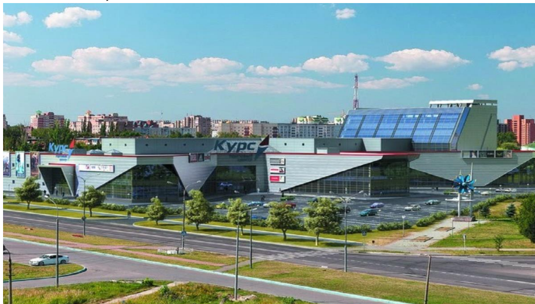
Фото: торгово-развлекательный центр «Курс» г.Ступино

По итогам проведения конкурентных процедур размещено 58 нестационарных торговых объектов (без учета 63 автолавок).