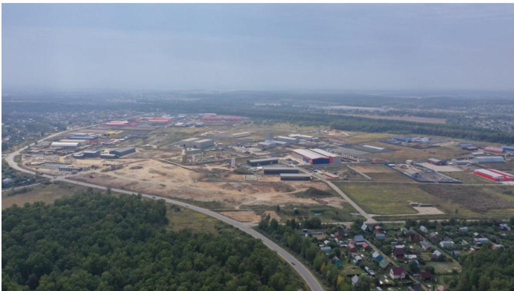
Промышленная площадка «Татариново-Парк» (промзона «Михнево М4»)

Международные экономические санкции негативно повлияли на прирост прямых иностранных инвестиций. При этом объем инвестиций резидентов Российской Федерации существенно вырос, что не только компенсировало снижение активности иностранных инвесторов, но привело к общему росту капиталовложений. Если за 9 месяцев 2022 года объем инвестиций в основные производственные фонды составил 8,8 млрд руб, а за 9 месяцев 2023 года - 11 млрд руб, то за аналогичный период 2024 года объем инвестиций вырос до 12,4 млрд руб или на 41 процент к объему 2022 года и на 12,7 процентов к объему 2023 года.