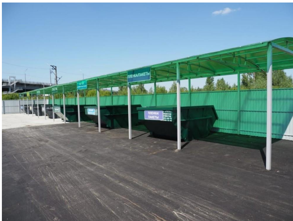
Фото: специализированная площадка для сбора крупногабаритных отходов «Мегабак» в г.Ступино