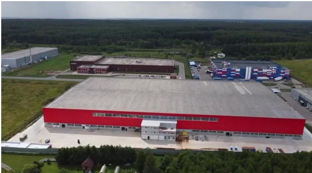
Производственно-складской корпус компании «Найснатс» в ОЭЗ «Ступино Квадрат»

Строительство завода по выпуску полезных снеков из семечек и сухофруктов, территория реализации - ОЭЗ «Ступино Квадрат». Срок реализации проекта: 2019-2025. Инвестиции – 1 млрд.руб, планируемые рабочие места – 131.