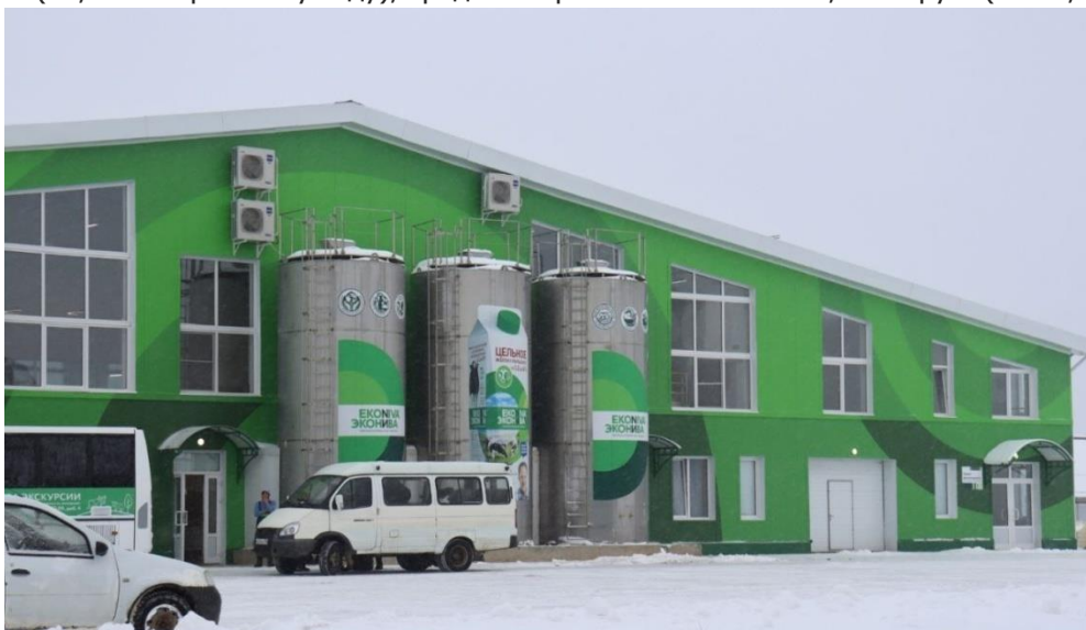
Фото: новое сельскохозяйственное предприятие – животноводческий комплекс «Бортниково»

Средняя численность работающих в сельскохозяйственных предприятиях за 2024 год составила 767 человек (89,9 % к прошлому году), средняя заработная плата - 75,2 тыс.руб. (на 26,4 % выше 2023 года).