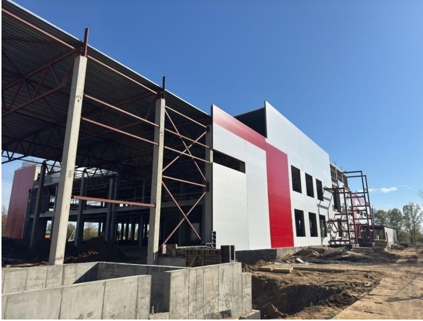
Фото: Строительство завода по производству майонеза и соусов ООО «ГК Печагин» в п.Михнево в рамках проекта «Земля за один рубль»

В 2024 году 4 инвестора получили в аренду земельные участки по льготной программе под реализацию проектов по производству импортозамещающей продукции, в том числе 3 являются субъектами МСП: