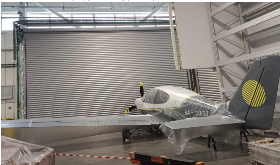
Центр развития авиации общего назначения компании «С7 АЭРО» в д.Торбеево

Строительство центра развития авиации общего назначения (самолеты Victory). Проект реализуется на собственном земельном участке в д.Торбеево (10 га). Проект комплексный, срок реализации 2019-2032гг. Объем инвестиций – 5 млрд.руб, планируемые рабочие места – 500.