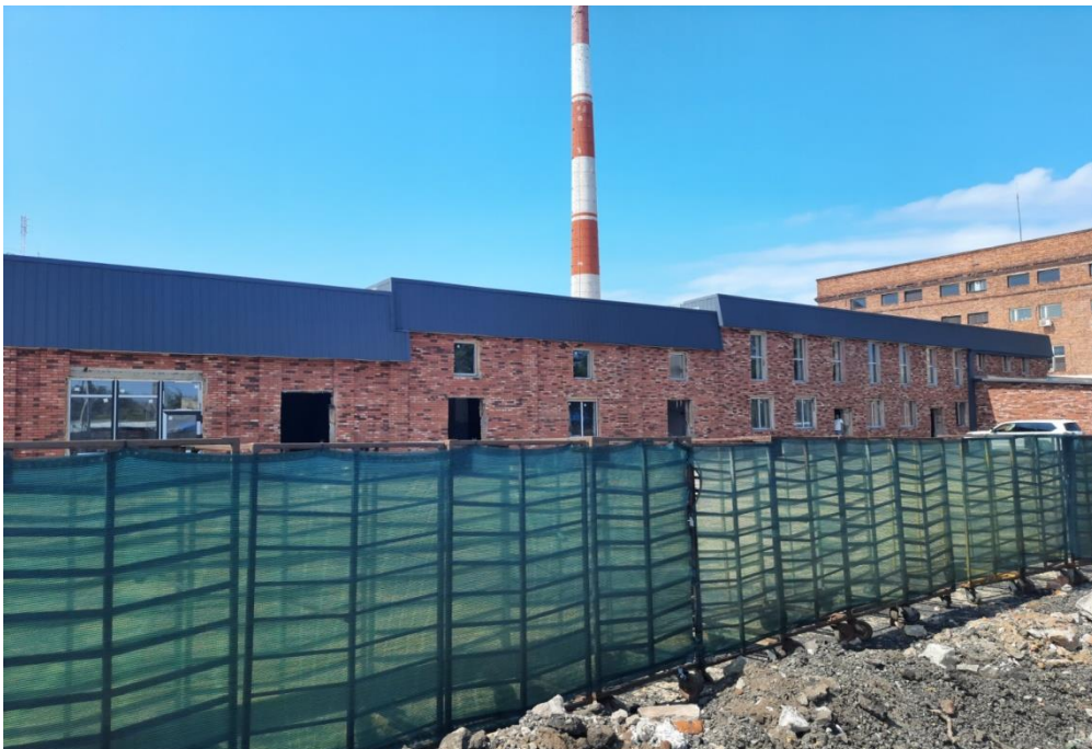
Реновация территории бывшего хлебозавода г.Ступино

В центре города ведется реновация территории Ступинского хлебозавода, построенного в 50-ые годы прошлого века. Это еще одна будущая точка притяжения, так как во внутреннем дворе завода планируется создание арт-зоны и креативного кластера. В настоящее время в одном из отреставрированных корпусов хлебозавода уже работают предприятия торговли и общественного питания. Проектом предусмотрена пекарня, поэтому горожане не останутся без свежей выпечки. Планируемый объем коммерческой недвижимости – 5000 кв.м. В результате реализации проекта будет создано 300 рабочих мест в сфере малого бизнеса.