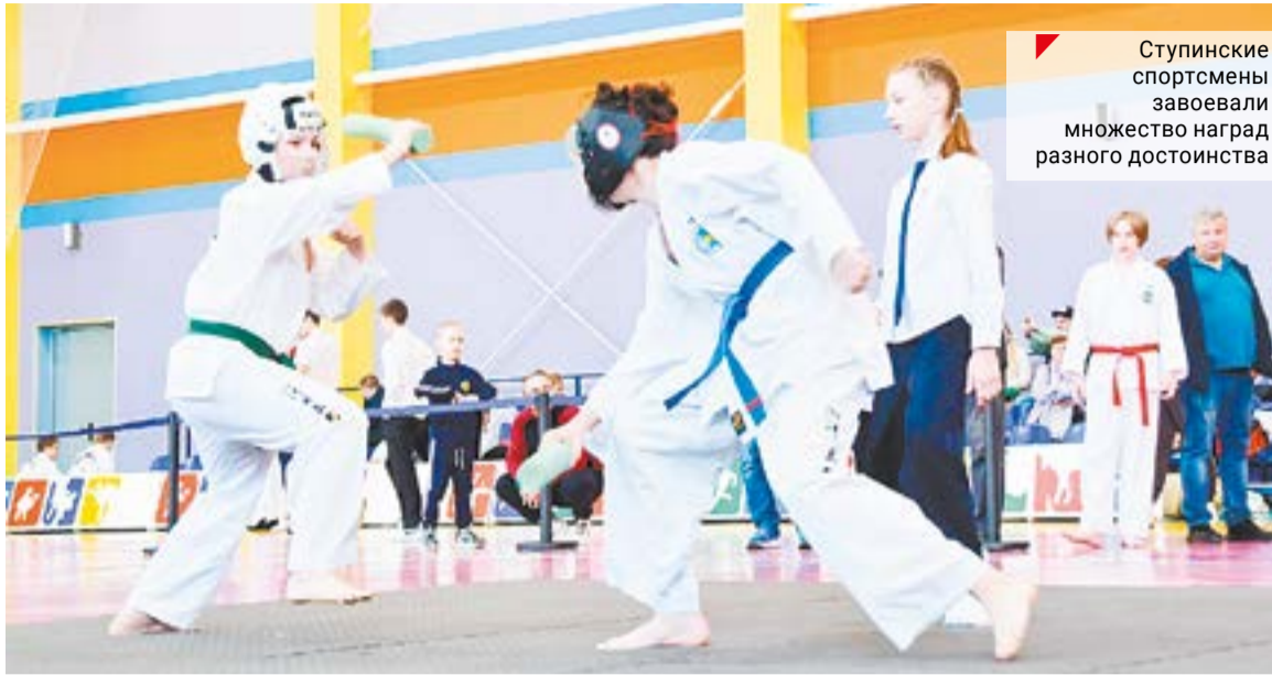
Ступинские спортсмены завоевали множество наград разного достоинства