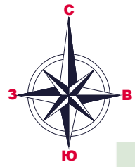
СХЕМА ОРГАНИЗАЦИИ ДВИЖЕНИЯ АВТОТРАНСПОРТА по адресу: Московская область, го Ступино, г.Ступино, ул.Андропова, д.58