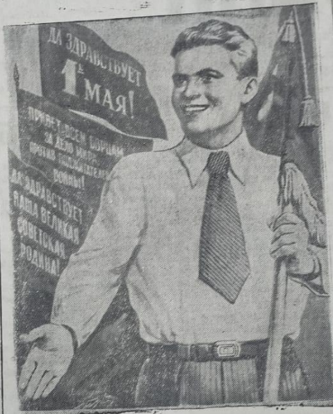
Плакат работы художника В. Иванова (издательство «Искусство»).