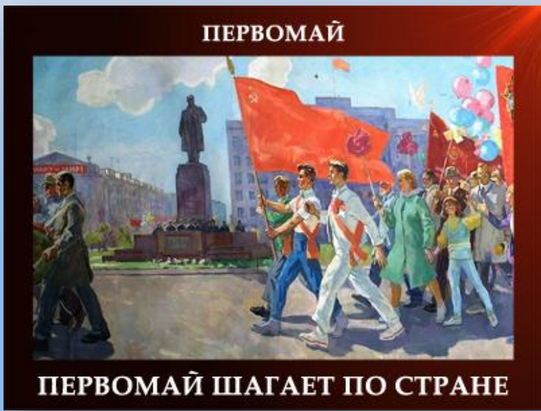
ПЕРВОМАЙ ШАГАЕТ ПО СТРАНЕ