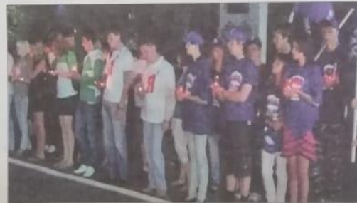
Акция «Свеча памяти», посвящённая Дню памяти и скорби.