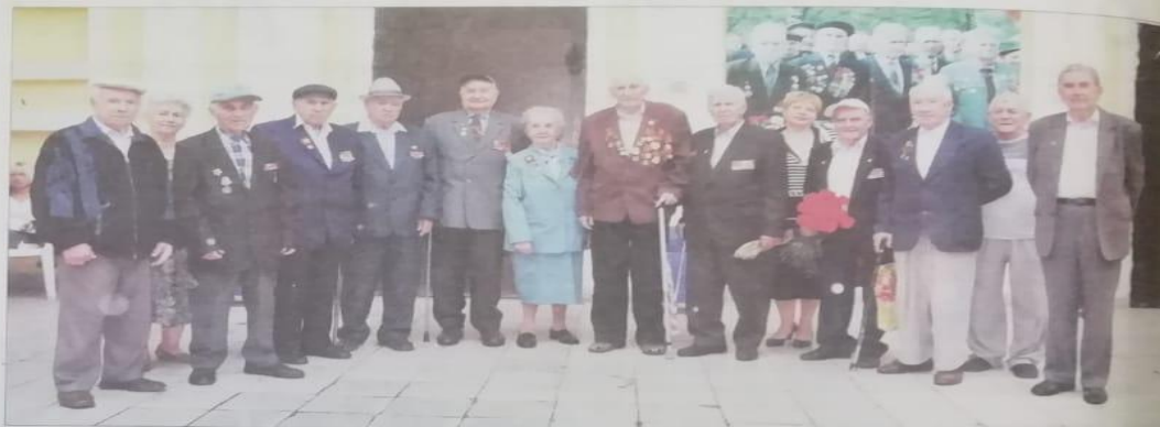
Фотография на память: участники Курской битвы.