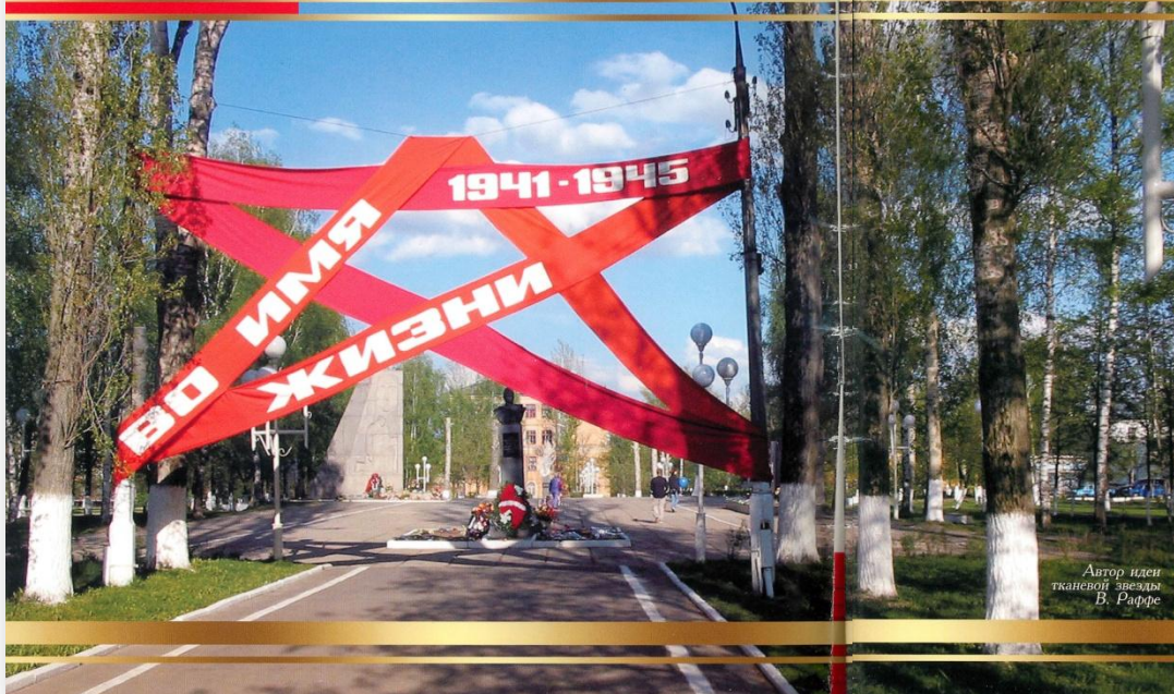
Автор идеи тканевой звезды В. Раффе