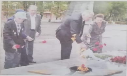
Возложение цветов на постамент у Вечного огня.

Двадцать третьего августа в сквере имени В.Ф. Полякова по традиции собрались участники Курской битвы. Пришли, к сожалению, не все.