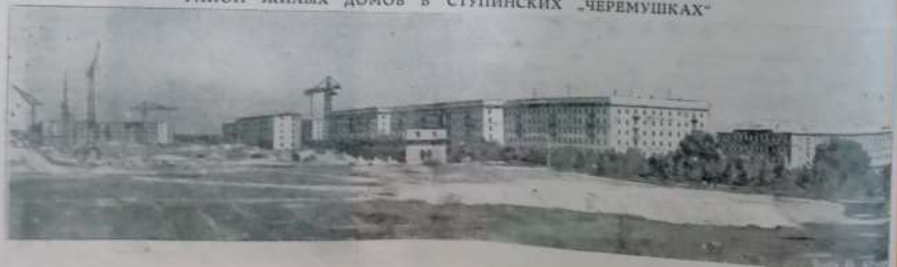
РАЙОН ЖИЛЫХ ДОМОВ В СТУПИНСКИХ „ЧЕРЕМУШКАХ“

В настоящее время в нашей стране растут новые кварталы. В настоящее время в нашей стране растут новые кварталы. В настоящее время в нашей стране растут новые кварталы. В настоящее время в нашей стране растут новые кварталы. В настоящее время в нашей стране растут новые кварталы. В настоящее время в нашей стране растут новые кварталы. В настоящее время в нашей стране растут новые кварталы. В настоящее время в нашей стране растут новые кварталы. В настоящее время в нашей стране растут новые кварталы.