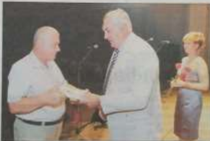
Чествование самых достойных представителей строительной отрасли.