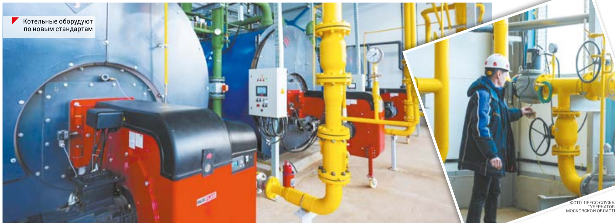
Котельные оборудуют по новым стандартам