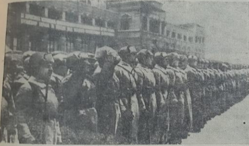
22 июня 1961 г. — 20 лет со дня нападения фашистской Германии на Советский Союз, Начало Великой Отечественной войны Советского Союза против фашистской Германии. Военный парад на Красной площади 7 ноября 1941 года.