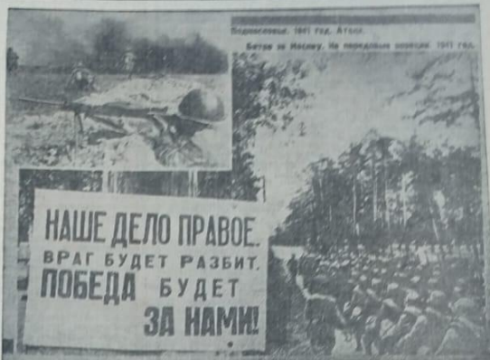
Батальоны. 1941 год. Атышу. Батальон в Меллеу. На передовой позиции 1941 год.

Одним словом, суровые уроки прошлого ярко свиде-