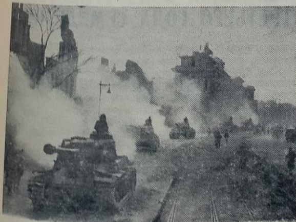
В Берлине. Советские танки проходят мимо Бранденбургских ворот.