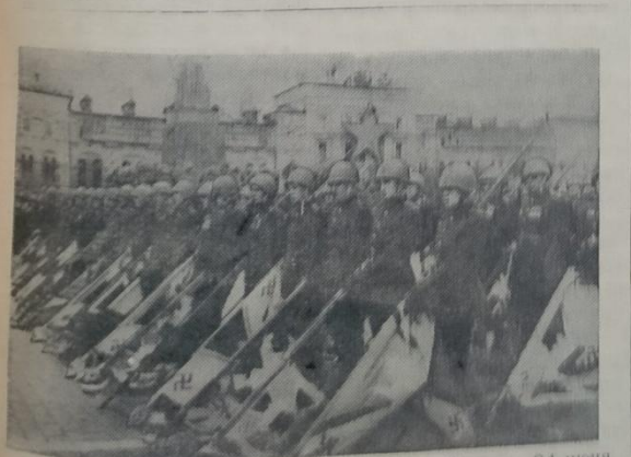
Парад Победы на Красной площади в Москве 24 июня 1945 г. На снимке: советские воины с захваченными у немцев знаменами.