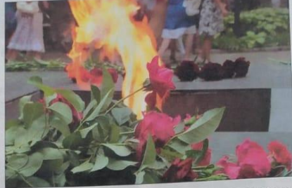
Вот так они от меня уехали, что началось война».