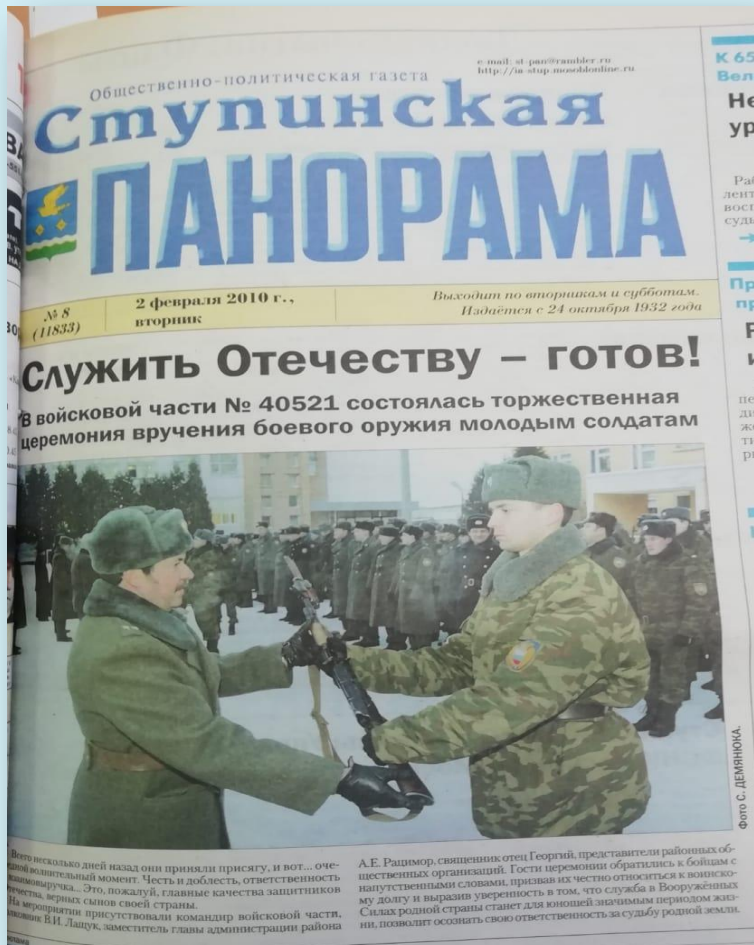
ф. 83 оп. 1 д. 149 л. 57