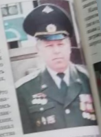
Ф.В. Дубцов , полковник Главного управления Генерального штаба.

В 1971 году я был призван в армию в Вооруженные Силы СССР. Это был первый шаг к моей военной службе. Я прошел все ступени военной службы: от рядового до полковника. Армия — это единая семья, где каждый должен выполнять свой долг.