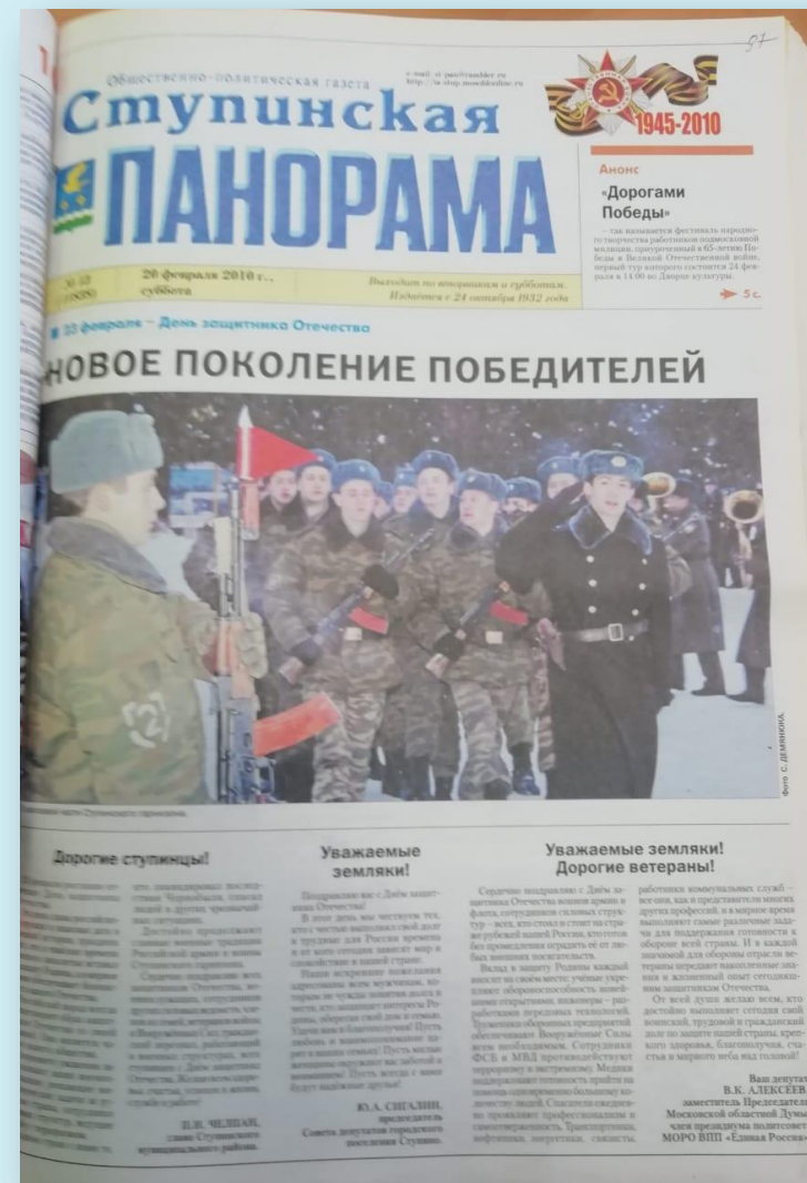
ф. 83 оп. 1 д. 149 л. 97