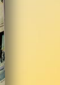
Масленичные забавы – самое волнующее событие зимы. Чтобы встретить весну и попрощаться с зимой.