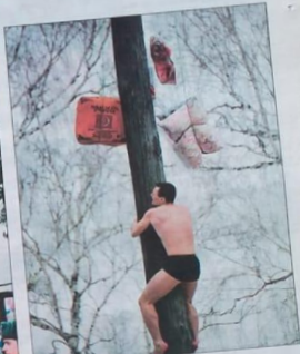
Последний метр – он трудный самый.