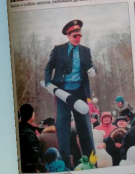
Там, где здесь нарушает?