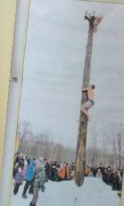
Одной из самых зрелищных масленич- ных забав был традиционный «Ледя- ный столб».

По специальному опросу по случаю маслинничного торжества можно сделать вывод, что Масленица удалась на славу!