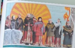
Какой праздник без песни?