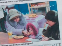
Блиннам все возрасты покорны!