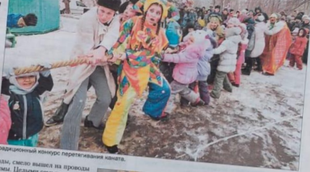
Традиционный конкурс перетягивания каната.

Широко да весело, с при- ступом размахом и уда- ливо расквашена с по- душкой второго марта Масленка