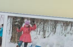
Борются для детей под открытым небом.