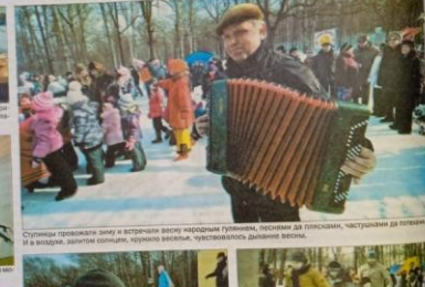
Ступинские проводят зиму и встречают весну народными играми, песнями, да танцами, участвуя в конкурсах. И в завершение, заплывы, прыжки, кортеновые забавы, частушечные дуэты.