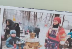
Утопайтесь, гости дорогие!