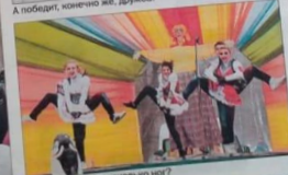
Ну-ка, сосчитайте, сколько ног?