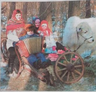
Все радости Масленицы были в этот праздничный день.

Ярко, весело и на широкую ногу провожали зиму в нашем городе. Так, в частности, на праздник Масленица, который организовал клуб общественного здоровья «Всадник» (в его составе активисты КСК «Всадник» и ступинские казачки) при поддержке МОБОУ ВИМК «Победа» и центра «Армеец» гости съехались не только из Ступина и района, но и Каширы.