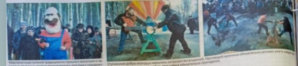
Масленица – яркое событие. Проводы зимы в Ступине и в окрестностях прошли с большим интересом. Состоялись различные конкурсы, выставки, мастер-классы, фотоконкурсы и шоу.