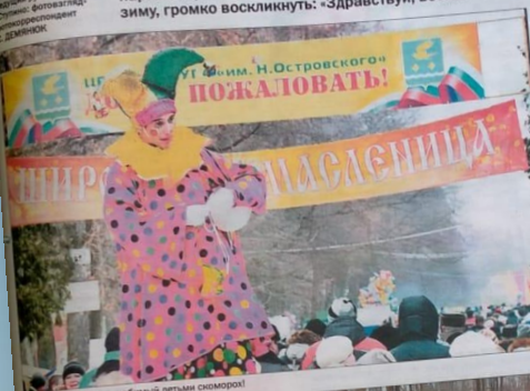
Высок и соборно неслось любимыми детьми скворец!