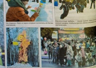
На стадионе «Лем» в парке впервые состоялась забег беговых лыж. В завершение праздника народными играми и танцами.