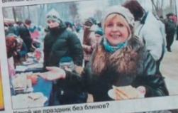
Какой же праздник без блинов?