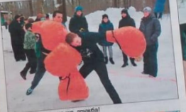
А победит, конечно же, дружба!