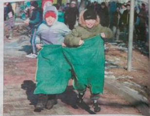
В микровском парке все желающие могли поучаствовать в забавных конкурсах.