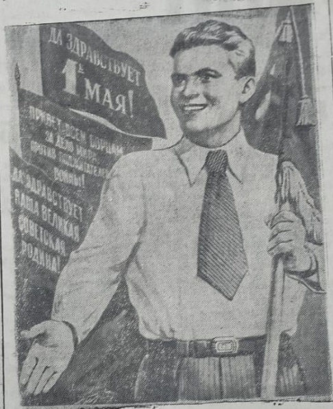
Плакат работы художника В. Иванова (издательство «Искусство»).