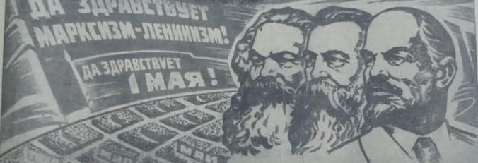
Плакат издательства «Московская правда».

С ПРАЗДНИКОМ, ТОВАРИЩИ! Заря Комуумы. Орган Студинского городского комитета КПСС и городского совета депутатов трудящихся. Четверг, 1 мая 1975 года. № 53 (6431). Цена 2 коп.