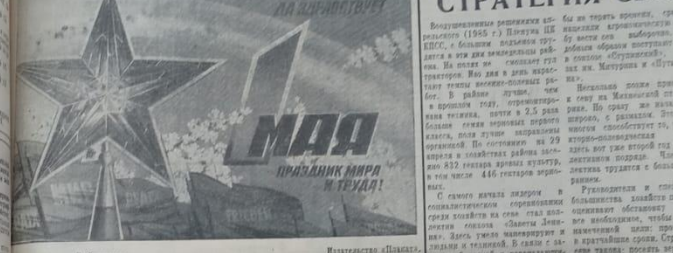
Плакат издательства «Московская правда».

С ПРАЗДНИКОМ, ТОВАРИЩИ! Заря Комуумы. Орган Студинского городского комитета КПСС и городского совета депутатов трудящихся. Четверг, 1 мая 1975 года. № 53 (6431). Цена 2 коп.