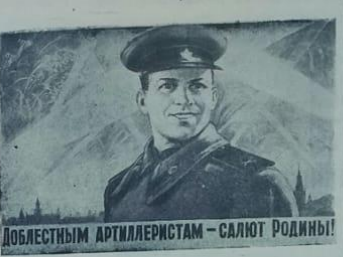
ДОБЛЕСТНЫМ АРТИЛЛЕРИСТАМ — СЯЛИТУ РОДИНЫ!

Наша Советская Родина и ее Вооруженная Сила отмечают сегодня День артиллерии. Празднование Дня артиллерии приурочено к знаменательной дате начала артиллерийской войны в 1942 году немецко-фашистских войск под Сталинградом. Эта величайшая историческая битва, в которой была окружена и полностью уничтожена 330-тысячная группировка гитлеровских войск, принесла Советской Армии и ее главной ударной силе — артиллерии — немеркнущую славу.