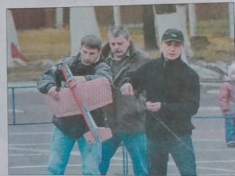
И ввысь взлетает самолёт...

справить грубейшую ошибку двадцатилетней давности. Тогда ведь не только разрушилась союзная держава, а был нанесён сокрушительный