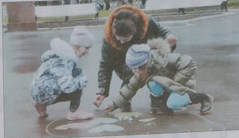
Мы рисуем... праздник!

– Отбросим в сторону все противоречия, все увязки, объединим сегодня силы, которые верят в